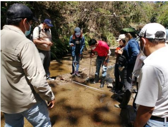
Foto 1. Aforo del manantial de Chacalapa en el Valle del Ángel, Apopa. Curso de hidrología e hidráulica.